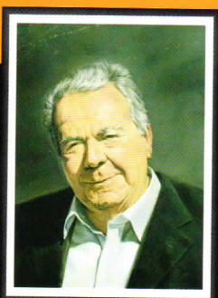
Un Ideal Sindical de Vida 1929-2013

“Hacer del Sindicato Petrolero de Córdoba, que es una institución relativamente pequeña, una organización poderosa , gravitante, en el contexto de las entidades gremiales de Córdoba, capaz de dar testimonio público de unidad, de laboriosidad, de lealtad hacia los principios básicos de un sindicalismo independiente de los partidos políticos, los empleadores y del Estado”.