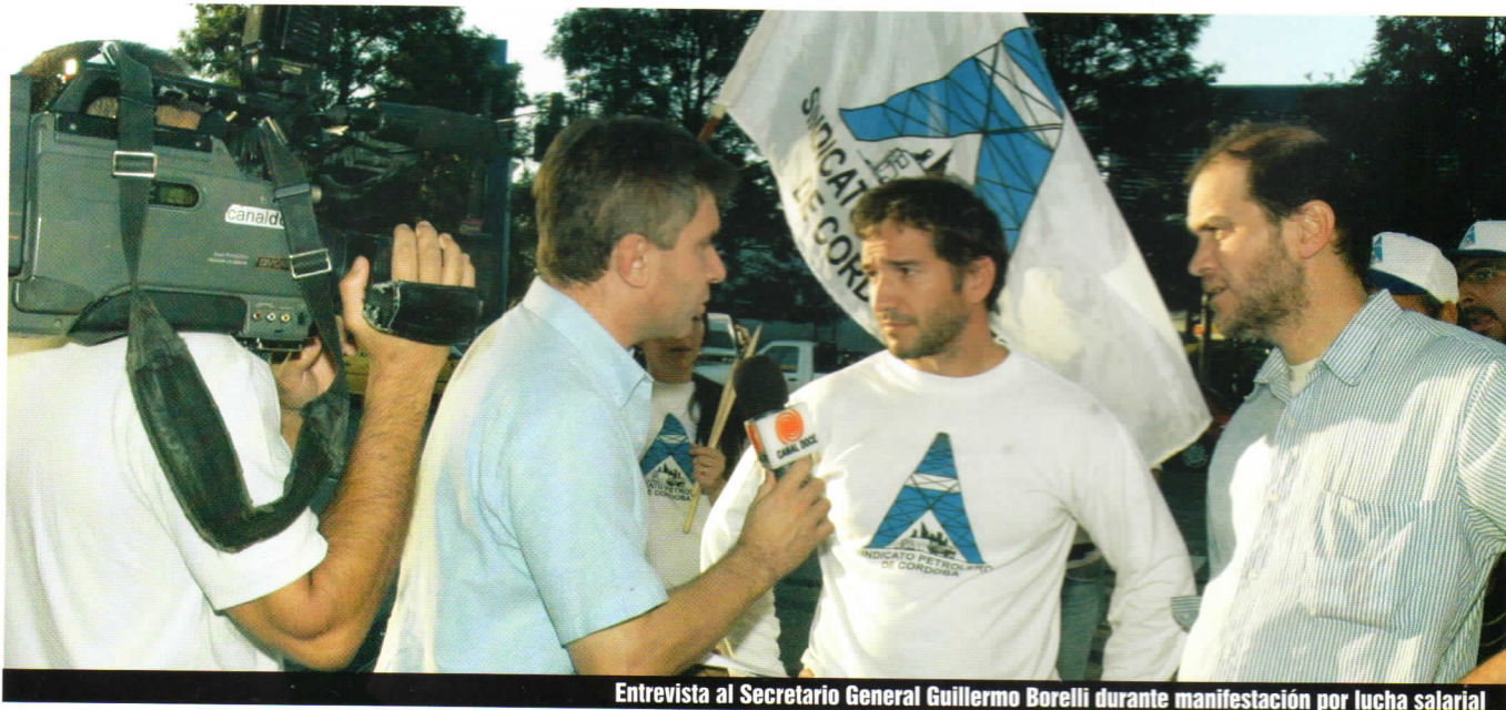
Entrevista al Secretario General Guillermo Borelli durante manifestación por lucha salarial

En el caso específico del sector que representamos, el petrolero, y más específicamente los trabajadores de estaciones de servicio y playas de estacionamiento, entendemos que el cierre liso y llano es posible