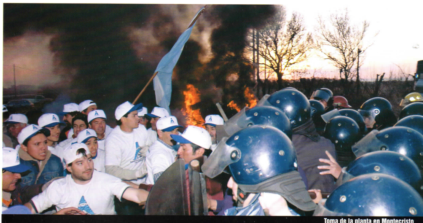
Toma de la planta en Montecristo

Conocemos también que existen servicios de los que la sociedad no puede prescindir por razones de fuerza mayor.