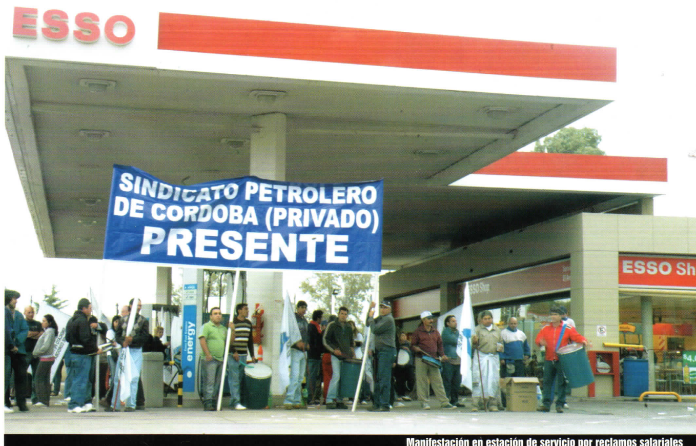
Manifestación en estación de servicio por reclamos salariales

2) El otro, tal vez más complejo aún, es el de lograr un descanso físico/mental adecuado; puesto que la rotación implica alterar los momentos de descanso trasladándolos al ritmo de sus turnos, durmiendo algunos días de noche y otros durante el día.