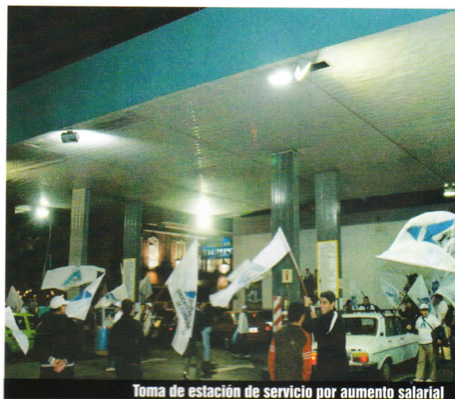
Toma de estación de servicio por aumento salarial

2) Una prueba de ello, nos apuramos a decir en sentido negativo pero prueba al fin, son los intentos de trasladarnos el poder de policía en cuestiones de tránsito intentando por ejemplo que controlemos el uso del casco en los motociclistas, penando a quien no lo tenga con la negativa a cargarle combustible. Incluso se registraron intentos, más trasnochados aún, de que realizáramos control de alcoholemia a los automovilistas con la modalidad anterior. Insistimos todo esto a trabajadores que desempeñan sus tareas de la manera que ya explicitamos.