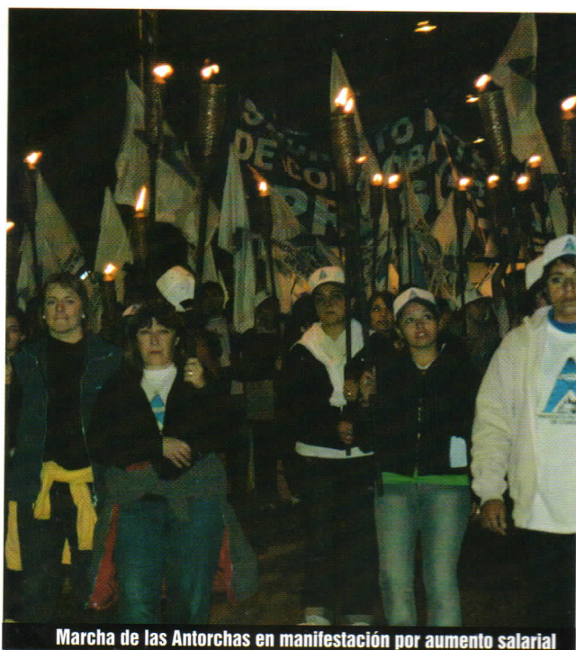
Marcha de las Antorchas en manifestación por aumento salarial

En el caso de los jóvenes se registra una gran cantidad de deserciones a poco de conocer y experimentar las condiciones descriptas de rotación de horarios y trabajo de toda la semana. Es redundante ampliar aquí las dificultades en la necesaria especialización de este trabajo que trae aparejado la altísima rotación que el rechazo a estas modalidades de trabajo tiene.